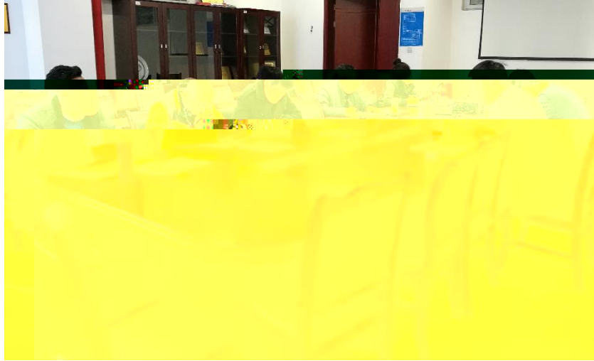
图1 学院党政领导联席会